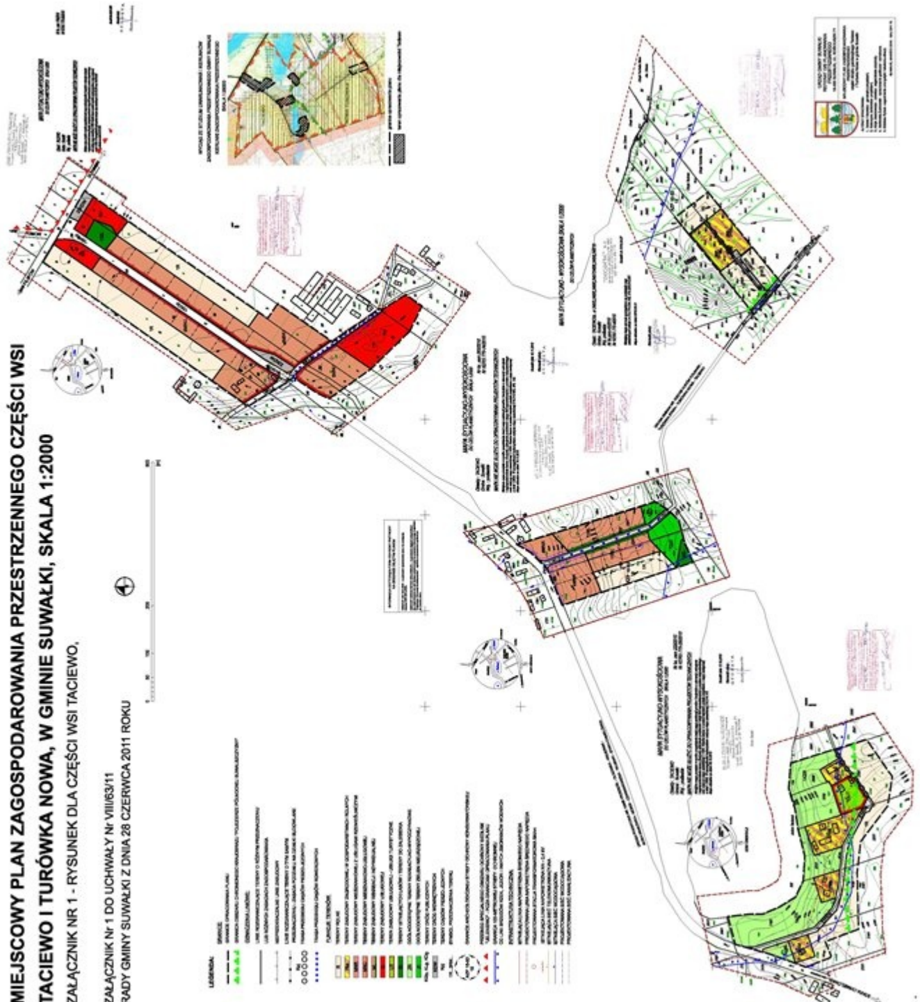
Rysunek planu dla części obrębu geodezyjnego Taciewo w skali 1:2000

Załącznik Nr 1 do Uchwały Nr VIII /63/11 Rady Gminy Suwałki z dnia 28 czerwca 2011 r.