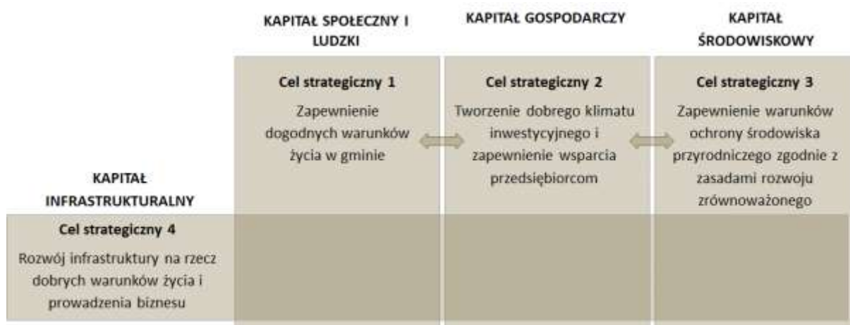
Rysunek 1. Układ celów strategicznych