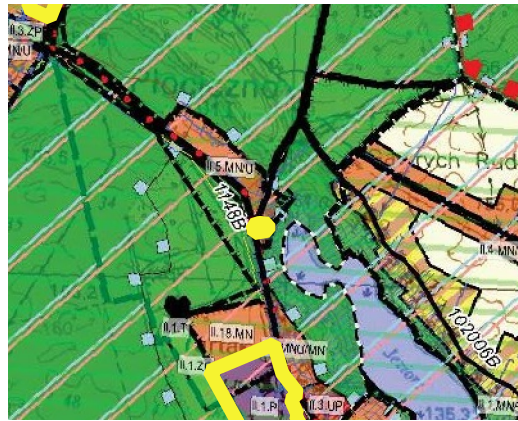
GRANICE TERENÓW OBJĘTYCH PLANEM MIEJSCOWY